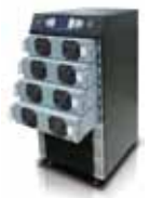
Масштабируемость и горячая замена