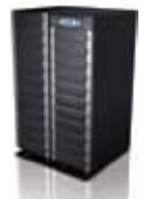
100-120 kVA + Батарейный кабинет