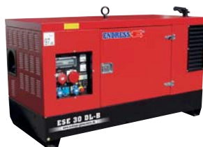
Электростанция ESE 30 DL-B