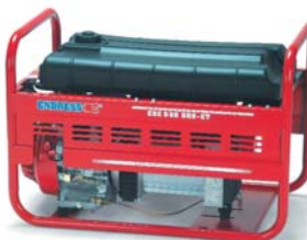
Электростанция ESE 606 DHS-GT