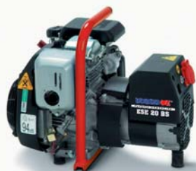
Электростанция ESE 20 BS