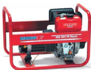
Электростанция ESE 404 YS Diesel