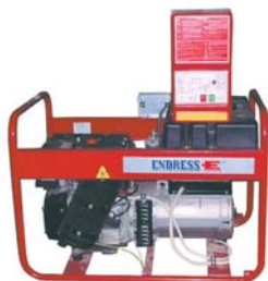
Электростанция ESE 904 DRS с панелью автоматки Amico